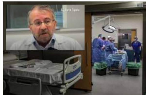
Un quirófano de cirugía plástica.